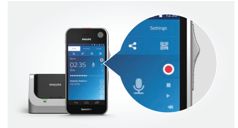
SpeechAir smartes Diktiergerät